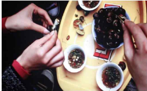
모 셋, 부산과 양곤의 손, 2012

수업개요 : 퍼포먼스 미술에 대해 알아보고, 미술 비평을 통해 모에 세트의 퍼포먼스 작업에 대한 미적 가치를 판단해 본다. 또한 작가의 이전 작품과 올 해 비엔날레 전시작품을 비교감상 함으로써 작가의 다양한 표현방식을 이해한다.